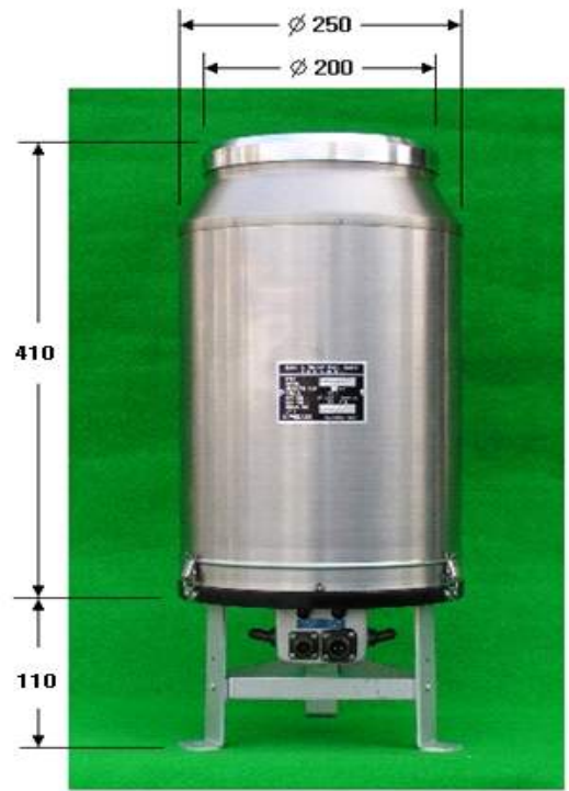
그림.3 외부 규격(바람막이 미부착시)