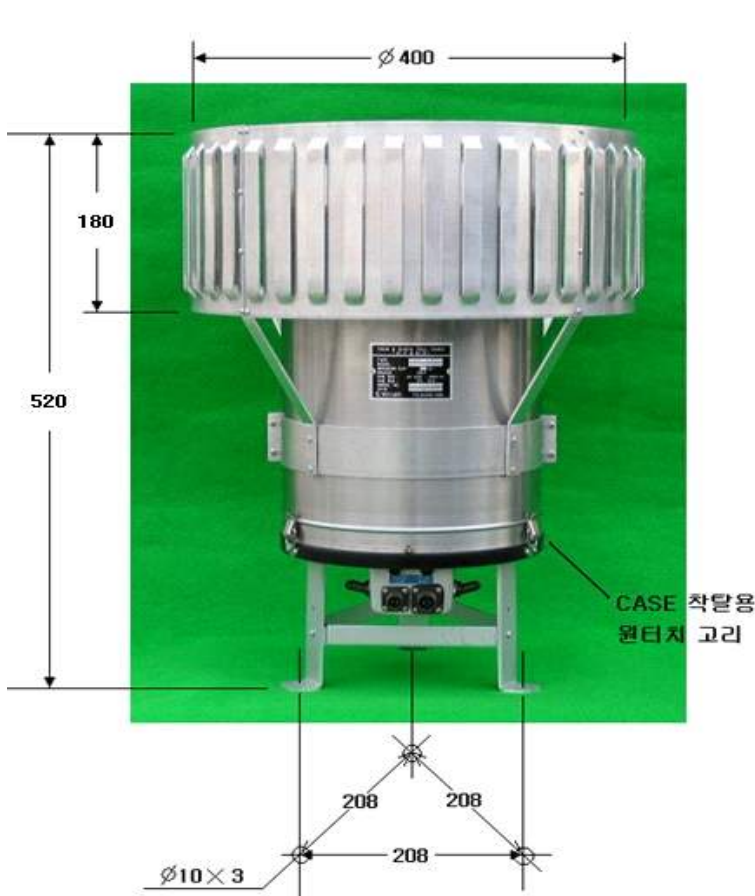
그림.2 외부 규격(바람막이 부착시)